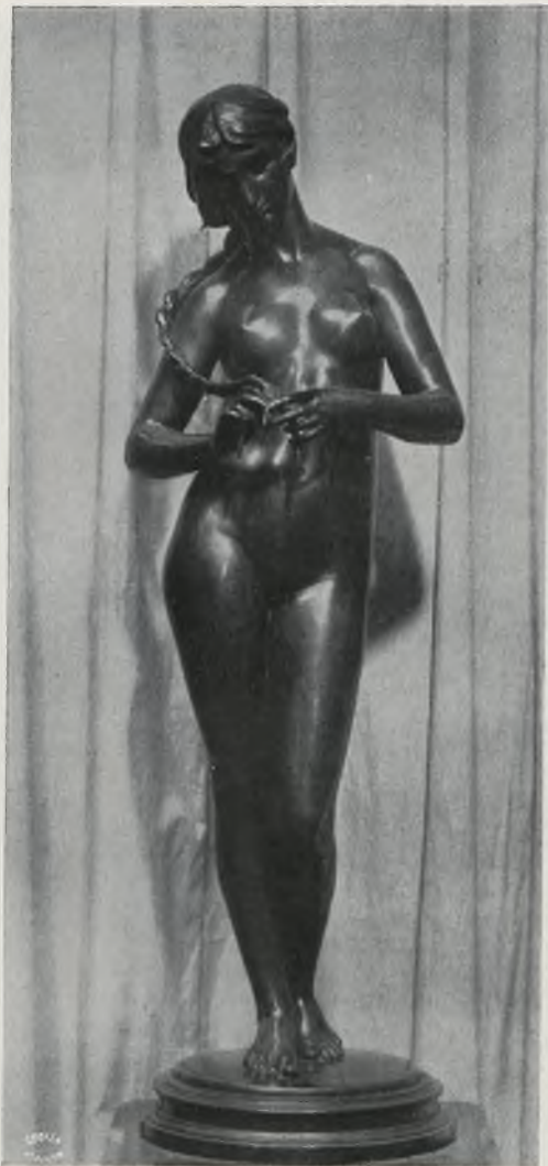
PIOTR WÓJTOWICZ STUDJUM (bronz) (Muzeum Narodowe w Krakowie)

malują przeważnie obrazy treści religijnej. Styka dorabia się z czasem znacznego majątku, przebywa głównie w swej posiadłości w Garches pod Paryżem, po wojnie nabywa piękną willę na Capri, gdzie spędza lato. Umiera w Rzymie w 1926 roku. Błotnicki po powrocie z Rzymu pracuje dłuższy czas w Krakowie, potem we Lwowie, umiera niedawno.