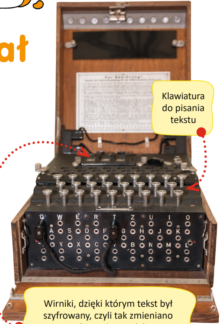
Klawiatura do pisania tekstu