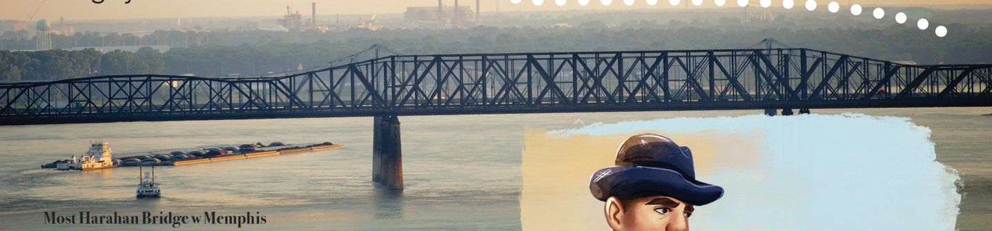
Most Harahan Bridge w Memphis

Najpierw uczył się w Stanach Zjednoczonych, a potem studiował we Francji na bardzo znanej uczelni.