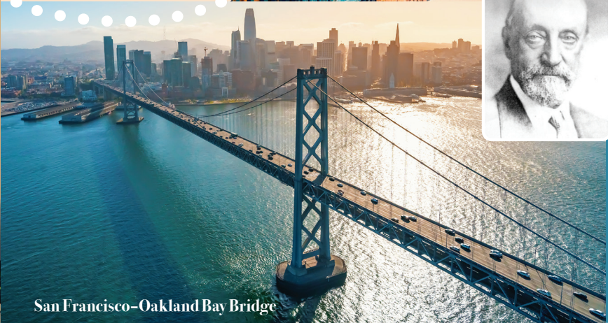
San Francisco–Oakland Bay Bridge

W Ameryce znany był jako Ralph Modjeski, ale na przykład w listach do rodaków podpisywał się jako Rudolf Modrzejewski. Świetnie mówił i pisał po polsku i zawsze podkreślał, że jest Polakiem.