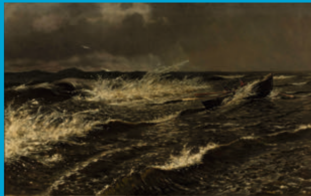
Stanisław Witkiewicz, „Bałtyk pod Połągą”

Połąga to miejscowość na Litwie nad Morzem Bałtyckim. Bywał tu Stanisław Witkiewicz. Odpoczywał i malował niezwykle pejzaże. Prawda, że są piękne?!