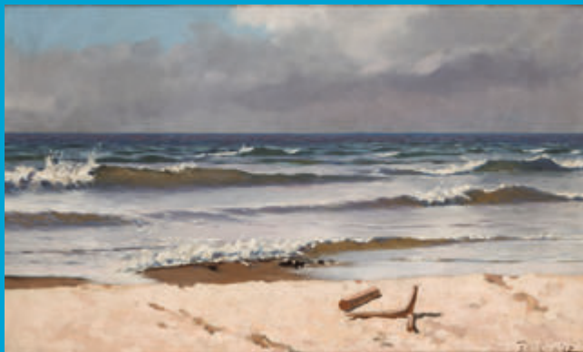
Stanisław Witkiewicz, „Wybrzeże pod Połągą”