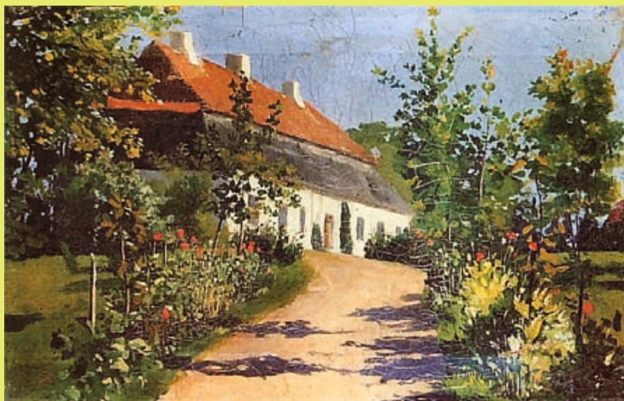
Stanisław Witkiewicz, „Dwór w Urdominie”