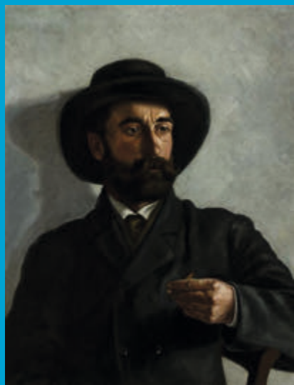
Stanisław Witkiewicz, „Autoportret”

Stanisław Witkiewicz stworzył tzw. styl zakopiański w budownictwie. Połączył tu elementy charakterystyczne dla sztuki górali spod Tatr i sztuki ludowej z Litwy. Inspirowały go na przykład litewskie drewniane rzeźby i kapliczki.