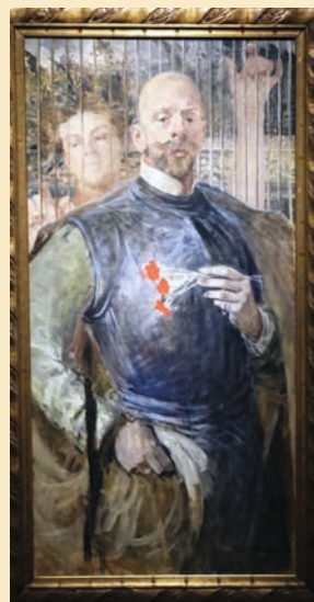
„Autoportret z żoną”, 1905 r.

ZWRÓĆ UWAGĘ NA DUMNY I SKUPIONY WYRAZ TWARZY ARTYSTY NA KAŻDYM Z PŁÓCIEN.