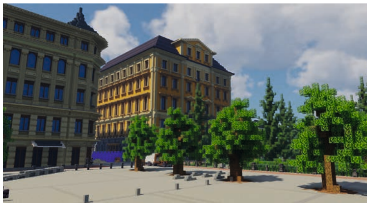
Dom Aukcyjny Bukowskis w Sztokholmie, w Szwecji