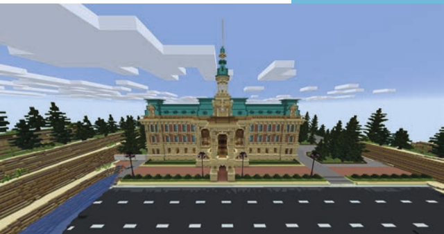
Budynek Rady Miejskiej w Baku, w stolicy Azerbejdżanu