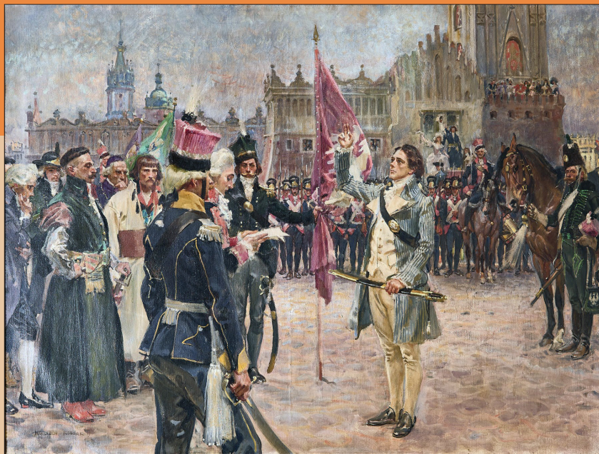
Wojciech Kossak, „Przysięga Kościuszki na rynku w Krakowie” – oryginalny obraz można zobaczyć w muzeum w Solurze.

Były to czasy, kiedy zaborcy rozdzielali między siebie ziemię Polski. Ale Polacy próbowali walczyć o niepodległość. W 1794 roku wybuchło powstanie narodowe (walki zbrojne). 24 marca na rynku krakowskim Tadeusz Kościuszko złożył narodowi polskiemu uroczystą przysięgę i objął przywództwo powstania jako Najwyższy Naczelnik Siły Zbrojnej Narodowej. Powstanie to nazywane jest od jego nazwiska: powstaniem kościuszkowskim lub insurekcją kościuszkowską.