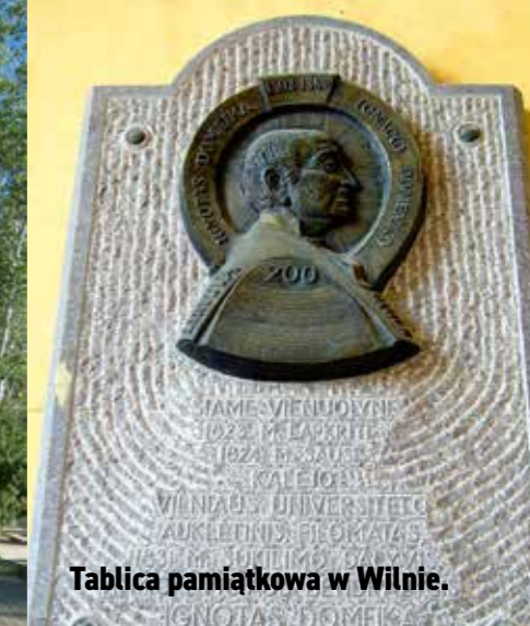
Tablica pamiątkowa w Wilnie.

Ozdobiony pomnikiem grób Ignacego Domeyki znajduje się na cmentarzu w Santiago w Chile.