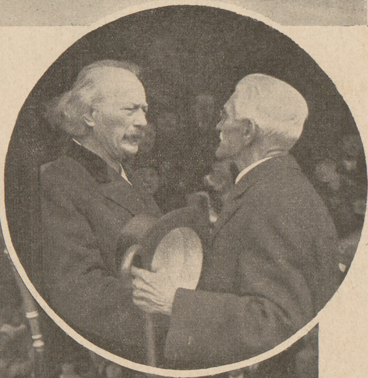
Ign. Paderewski i marszałek Sejmu Ignacy Daszyński