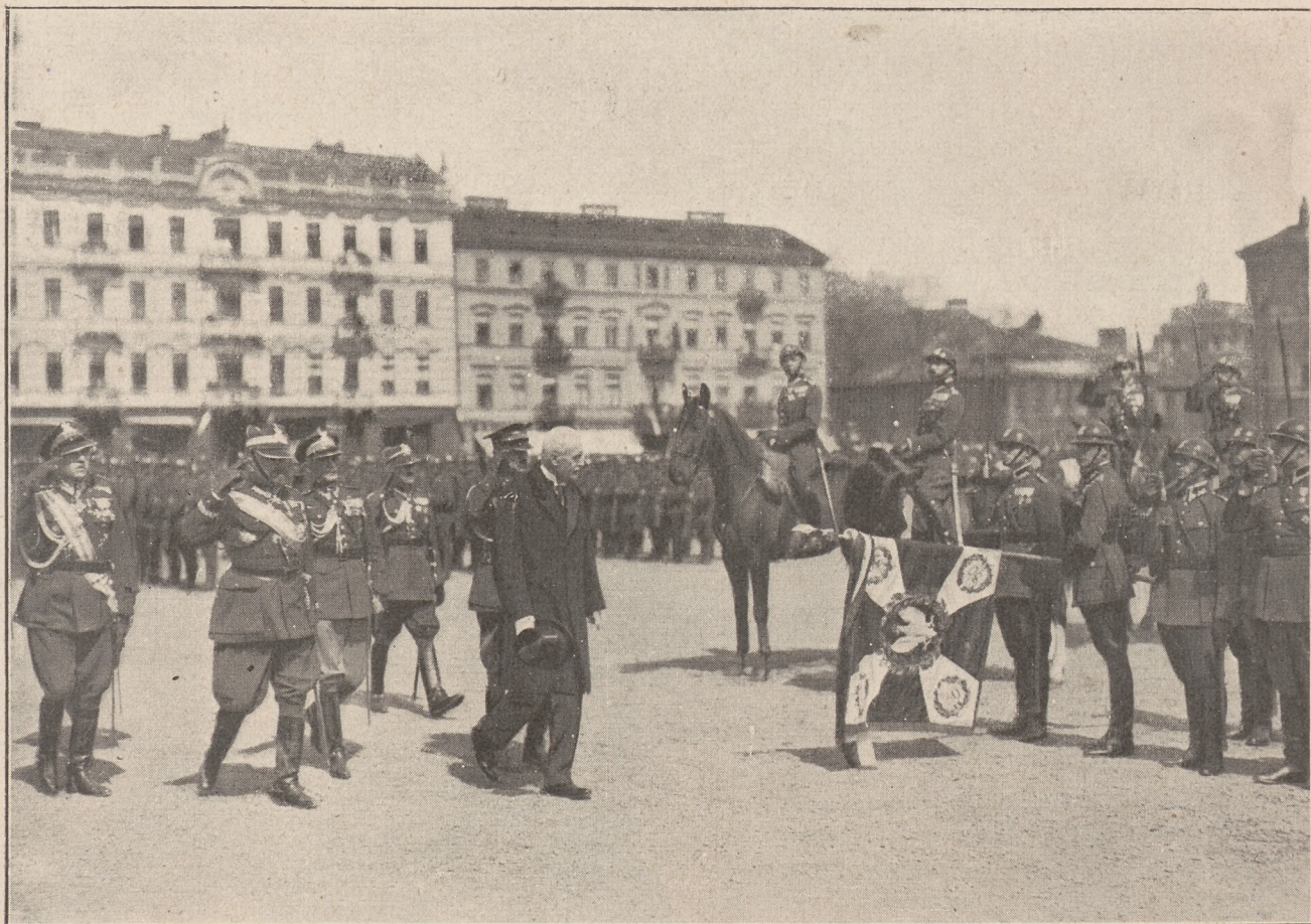
P. Prezydent prof. Ig. Mościcki, czyni przegląd wojsk na placu im. Piłsudskiego w Warszawie