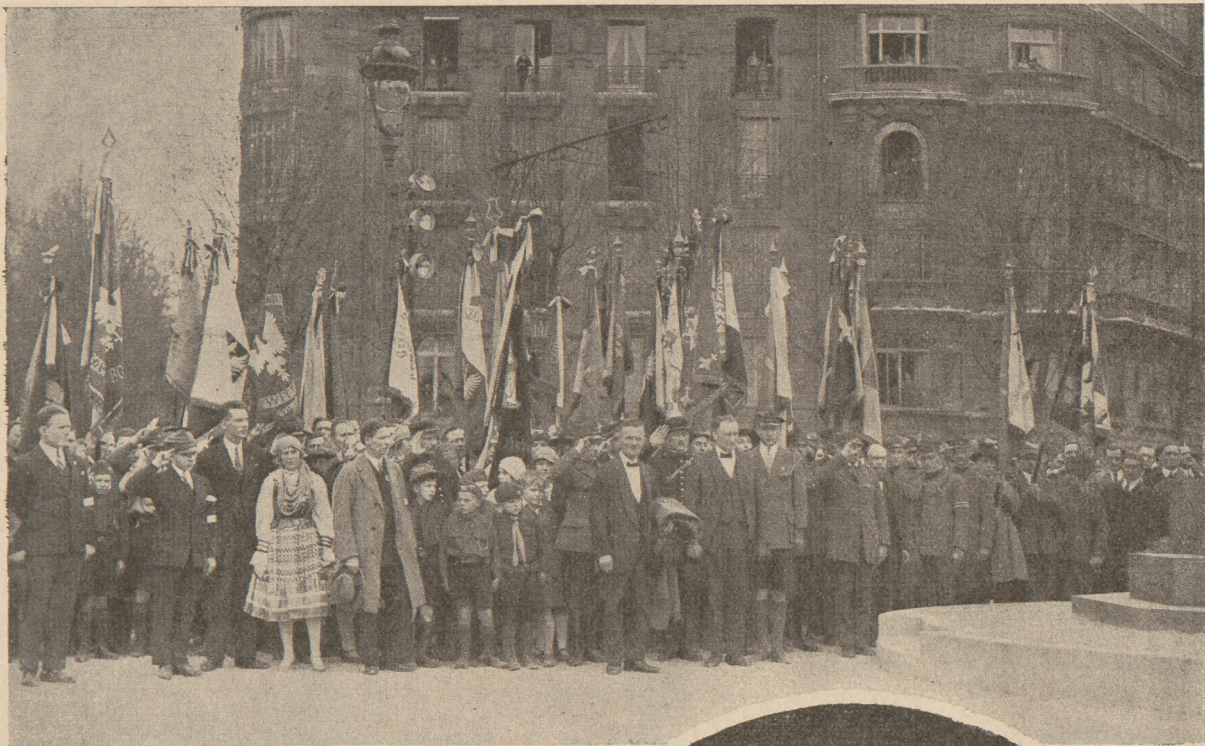
Sztandary towarzystw polskich podczas wykonyw. hymnów narodowych